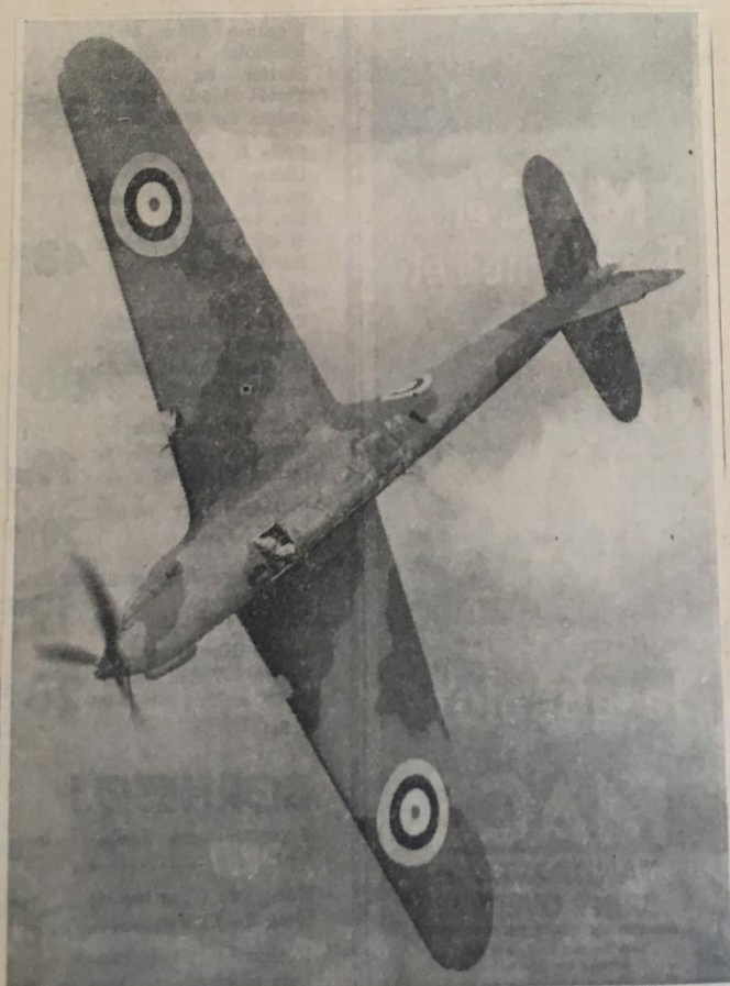
Et usædvanligt Billede af en anden af de nye Bombardementsmaskiner, der deltog i Manøvren. Det er en middels stor Fairly-Bomber. Bemærk Camouflagen paa Planerne.